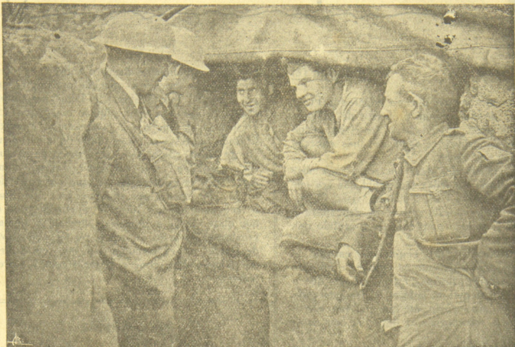
Jornalistas ingleses fallando com soldados canadinos n'uma trincheira franceza.