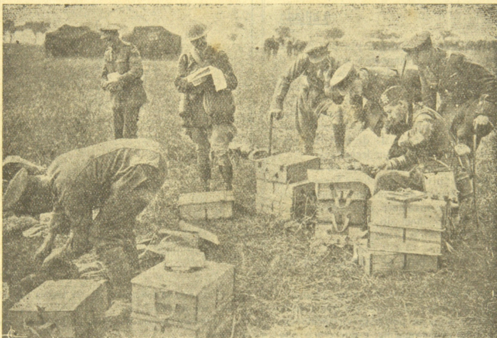
Officiaes d'uma brigada ingleza estudando os mappas.