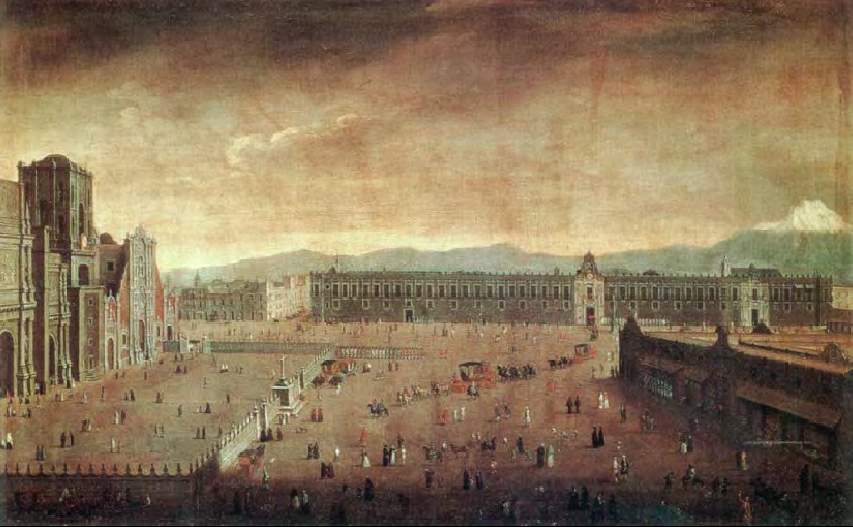
La plaza mayor de la Ciudad de México (finales del siglo XVIII)